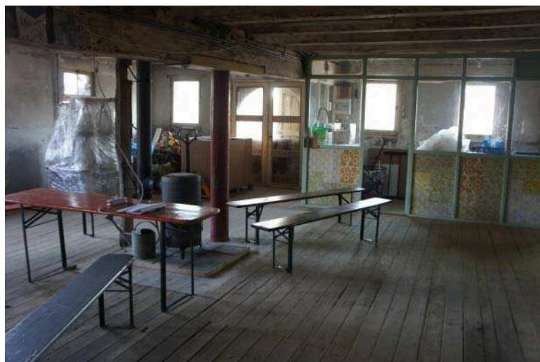
Een verhuurbare ruimte in de SodaFabriek Schiedam

Maar, over de veiligheid in het pand moet natuurlijk geen discussie ontstaan, geeft ze toe. 'Met geld uit de crowdfunding-actie, subsidie van de Rijksdienst voor het Cultureel Erfgoed en een eigen investering is de renovatie betaald, nu moeten we zorgen dat de vluchtwegen op orde zijn en er in het pand op grote schaal gewerkt en gelogeed kan worden. Daarom heeft brandveiligheid de hoogste prioriteit, maar we zijn ook bezig het pand klimaattechnisch te verbeteren.'