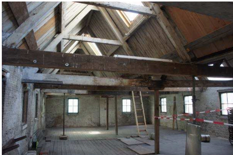
Bovenverdieping van de SodaFabriek Schiedam waar de Bed-and-Breakfast komt.