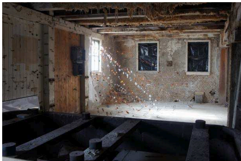
In de 20e eeuw werd soda geproduceerd in de fabriek, op sommige plekken is de soda nog niet van de balken verwijderd.

Op de crowdfunding-website Crowdboutnow plaatste de groep initiatiefnemers achter 'de Sodafabriek' een jaar geleden een wervend filmpje over de mogelijke herbestemming van twee historische pakhuizen aan de Schiedamse Buitenhaven. Twee dagen voor de deadline was het benodigde bedrag van 75.000 euro binnen, negentig investeerders hadden besloten het initiatief te ondersteunen. 'Er zijn twee typen investeerders', vertelt Van den Berg. 'De mensen die het je gunnen, maar ook investeerders die serieus kijken naar het rendement van het project. Voor deze investering bieden we 4 procent rendement over drie jaar. Dat haal je niet als je je geld op een spaarrekening zet.'